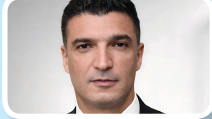
المهندس خالد هاشم وزير الصناعة

أش ١ نفت وزارة الصناعة، صحة التصريحات المنسوبة إلى المهندس خالد هاشم وزير الصناعة، والتي تم تداولها أمس عبر بعض صفحات التواصل الاجتماعي، بشأن المصانع المتعثرة أو المصانع الجاري إنشاؤها أو المصانع المغلقة، مؤكدة أن هذه التصريحات غير صحيحة ولم تصدر عن الوزير.