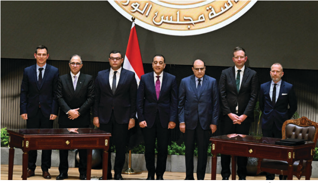
رئيس الوزراء: مشروع المونت جلاله يتفق مع المخطط الاستراتيجي القومي لمصر

على ساحل البحر الأحمر، وبمثل إضافة كبيرة جدا، في ظل ما يُعرف عن منطقة العين السخنة بكونها مقصدا للسياحة قصيرة الأجل، التي لا تتجاوز عدة أيام بسيطة، وترتبط دوريا بمطلة نهاية الأسبوع، ولكن مع هذا المشروع فنحن نتحدث عن تنمية متكاملة تستمر على مدار الأسبوع، وعلى مدار الشهر، بل وعلى مدار العام كله، خاصة مع وجود مدينة الجلالة، هذا المشروع الملحق القومي الذي يمتد بينته الدولة المصرية، وكذا الجامعة الكبيرة التي أقيمت هناك، وبوعية هذه المشروعات والطرق، وقرب هذا المكان من العاصمة الجديدة.